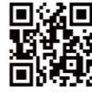
米カラー施術動画